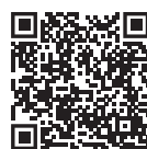
強積金計劃說明書

有關信安強積金計劃 800 系列的詳情，請到以下網站參閱信安強積金計劃 800 系列的強積金計劃說明書 ( principal.com.hk/sites/default/files/general-files/S800_C.pdf ) 及集成信託契約 (只提供英文版本) ( principal.com.hk/sites/default/files/general-files/S800_Master_Trust_Deed.pdf )。