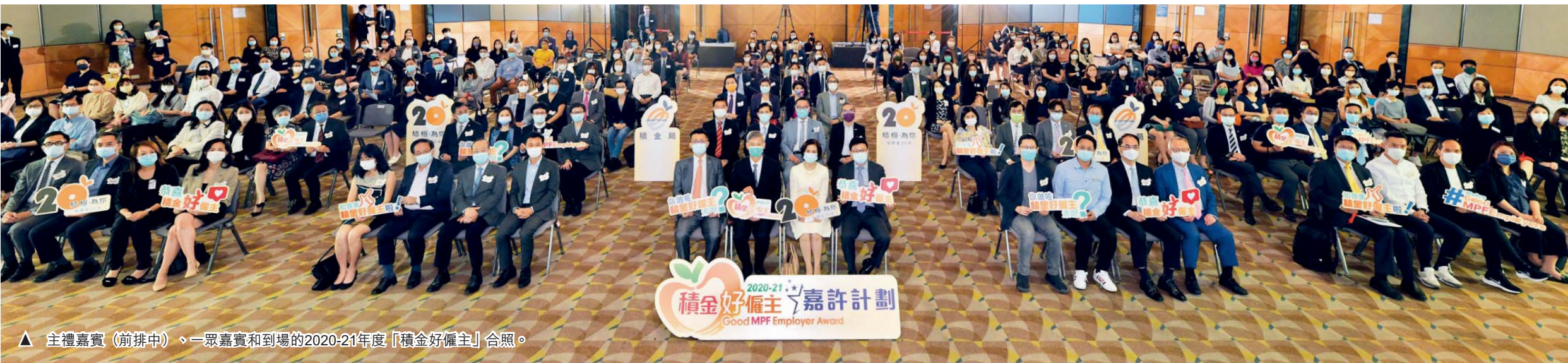
▲ 主禮嘉賓（前排中）、一眾嘉賓和到場的2020-21年度「積金好僱主」合照。

積金局日前舉行2020-21年度「積金好僱主」嘉許典禮。本年度共有1,740間公司和機構獲得嘉許，創計劃設立7年以來新高。當中284間為首次參加，反映愈來愈多僱主重視僱員的退休保障。嘉許計劃自2015年舉辦以來，已有近2,500名僱主獲頒這項殊榮，共僱用接近25萬名員工。本年度的「積金好僱主」嘉許計劃特設「積金好僱主5年+」及「全能積金好僱主」兩個獎項，以表揚多年來不斷為僱員提供更佳退休福利的模範僱主。