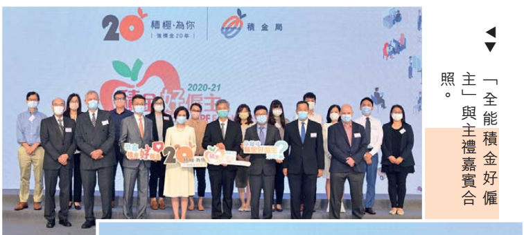
「全能積金好僱主」與主禮嘉賓合照。