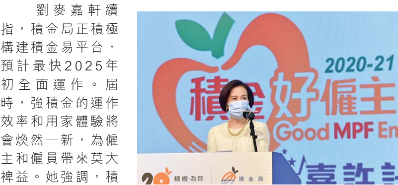
▲ 積金局主席劉麥嘉軒

劉麥嘉軒續指，積金局正積極構建積金易平台，預計最快2025年初全面運作。屆時，強積金的運作效率和用家體驗將會煥然一新，為僱主和僱員帶來莫大裨益。她強調，積金易平台的成功關鍵，在於平台使用率，並呼籲僱主盡早使用受託人提供的電子工具和服務處理強積金，為日後使用積金易平台作準備。