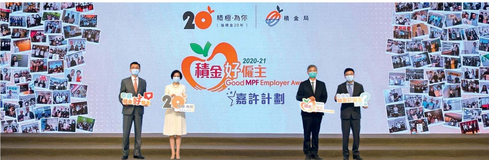
▲ 勞工及福利局局長羅致光博士（右2）、勞工處處長孫玉菡（右1），以及積金局主席劉麥嘉軒（左2）和署理行政總監鄭恩賜（左1）為2020-21年度「積金好僱主」嘉許典禮擔任主禮嘉賓，與一眾「積金好僱主」作虛擬大合照。

積金局日前舉行2020-21年度「積金好僱主」嘉許典禮。本年度共有1,740間公司和機構獲得嘉許，創計劃設立7年以來新高。當中284間為首次參加，反映愈來愈多僱主重視僱員的退休保障。嘉許計劃自2015年舉辦以來，已有近2,500名僱主獲頒這項殊榮，共僱用接近25萬名員工。本年度的「積金好僱主」嘉許計劃特設「積金好僱主5年+」及「全能積金好僱主」兩個獎項，以表揚多年來不斷為僱員提供更佳退休福利的模範僱主。