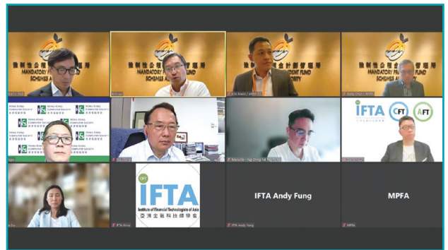
與不同持份者團體進行了104場實體及網上諮詢會